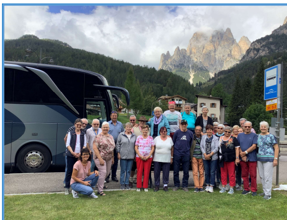
Vereinsferien in Salorno/Salurn im Südtirol 2022